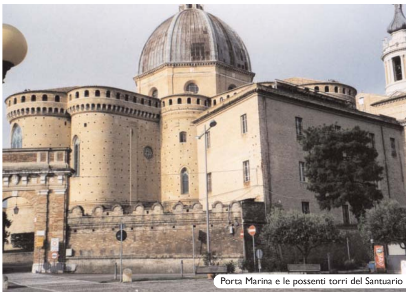
Porta Marina e le possenti torri del Santuario

Area attrezzata Camper Via C. Maccari - Cell. 333 7013069 Costo 9,00 / cam./ gio.