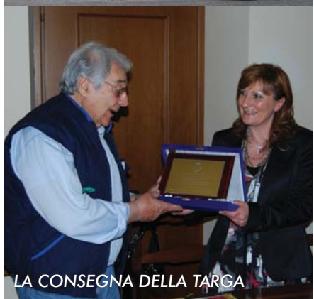
LA CONSEGNA DELLA TARGA