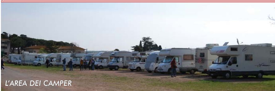
L'AREA DEI CAMPER