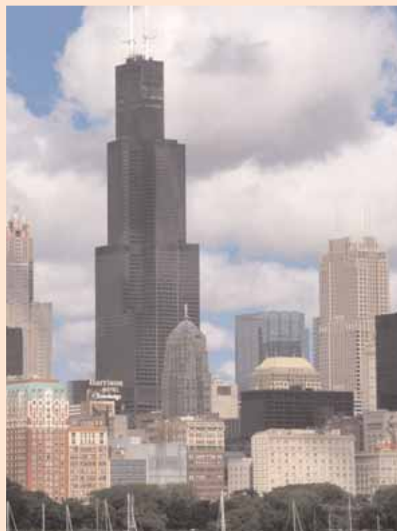
CHICAGO- SEARS TOWER

Oggi affrontiamo un lungo percorso sulla Interstate 55 per raggiungere Chicago. La strada è scorrevole e attraversa campi coltivati a mais che si estendono fino quasi a Chicago. Durante il percorso lasciamo la 55 per transitare su alcuni tratti della Statale 66, mitica strada conosciuta come "Coast to coast" lunga seimila chilometri che congiunge Chicago a Los Angeles, tagliando in due il continente americano. Regine di questa strada sono le mitiche Harley Davidson. Riprendiamo la Interstate 55 e in prossimità di Chicago subiamo la solita tempesta di pioggia. Il cielo si fa improvvisamente buio, la visibilità si riduce pressoché a zero e siamo costretti a fermarci sotto un ponte ed attendere che cessi il temporale. Riprendiamo il viaggio appena possibile fino al Camping di Joliet che dista circa cinquanta chilometri da Chicago.