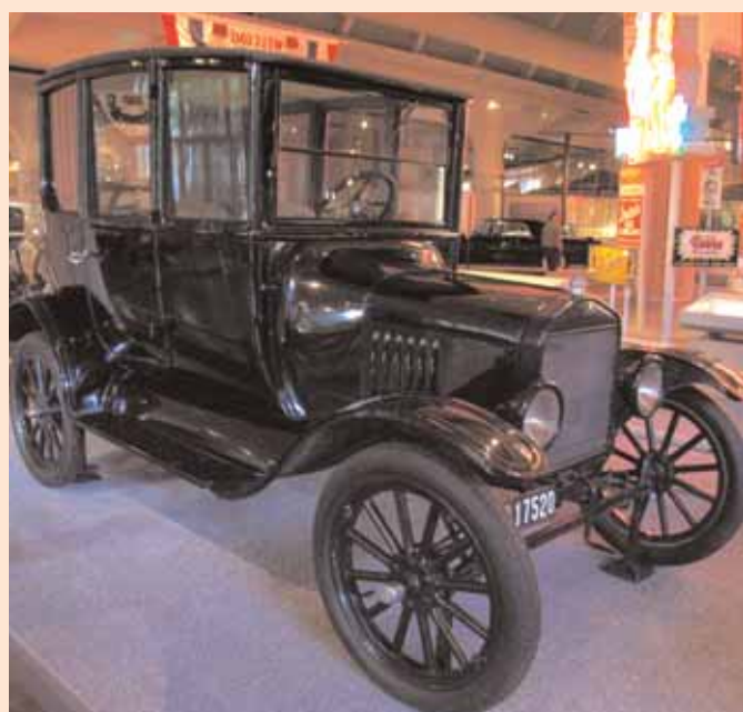
DETROIT MUSEO FORD MOD. T

L'autista ci riprende verso le 16 e ci porta in centro città nella zona dei grattacieli: il luogo è elegante, con bei negozi, molta gente dedita allo shopping; prati curati, fiori dappertutto. Visitiamo anche il negozio dell'Apple e poi giunta la sera risaliamo sul bus per rientrare al camping.