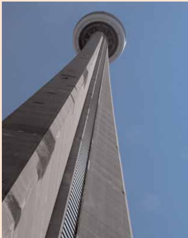
TORONTO CANADIAN NATIONAL TOWER

A l mattino con la collaborazione del gestore del camping, noleggiamo un bus con autista che ci condurrà a Toronto. Con nostra graditissima sorpresa il mezzo è uno scuola bus giallo, tipicamente inglese. Giunti nel centro di Toronto ci addentriamo nel traffico locale. Diamo appuntamento all'autista per il rientro per le ore diciotto. Visitiamo la Canadian National Tower, una torre alta 553 m dove, dicono, esista il ristorante più alto del mondo.