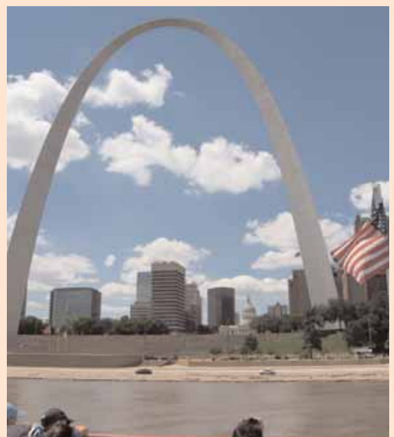
ST. LOUIS GATEWAY ARC

Dopo la visita al tribunale, ci dirigiamo verso la "Jefferson National Exspanion Memorial" dove si trova il Gateway Arch, imponente struttura in acciaio, opera dell'architetto finlandese Eero Saarinen. Nel primo pomeriggio prendiamo un battello caratteristico che ci porta lungo il fiume Mississipi e ammiriamo interessanti reperti di archeologia industriale dei secoli passati. Nel navigare al centro del fiume notiamo diverse chiatte che trasportano materiali, collegate