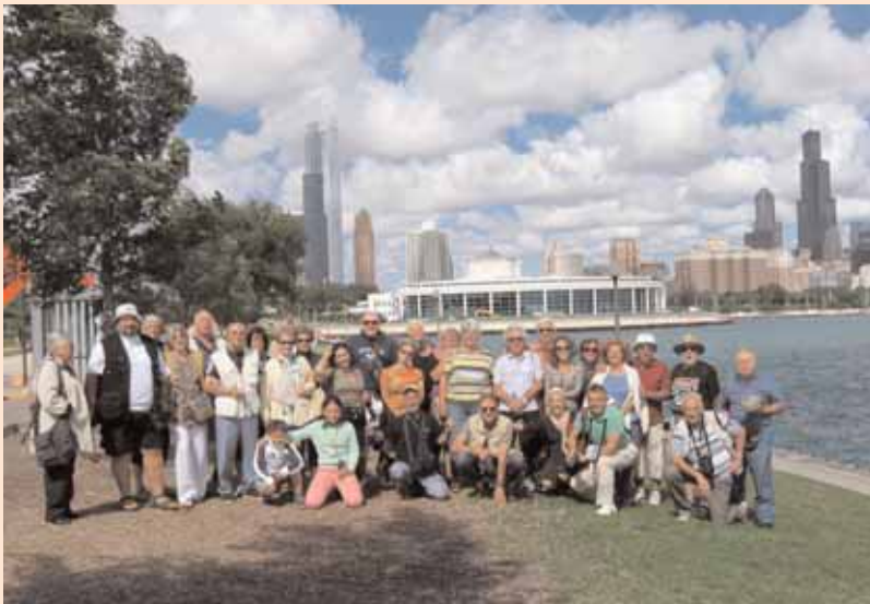
I PARTECIPANTI E LA DOWNTOWN DI CHICAGO

D opo avere programmato il navigatore, lasciamo il camping di Memphis e riprendiamo la Interstate 55. Il paesaggio cambia rispetto al profondo sud. Ai lati dell'autostrada notiamo immensi campi coltivati a mais, cereali ed altre coltivazioni. Durante il tragitto, a circa metà strada, compaiono all'orizzonte minacciose nuvole di un nero intenso, e improvvisamente ci troviamo in mezzo ad un temporale. In pochi attimi cadono circa 15 mm di pioggia; il vento si fa intenso, vicino a noi cade un fulmine e udiamo un boato spaventoso. Siamo costretti a fermarci e troviamo riparo nel piazzale di un supermercato.