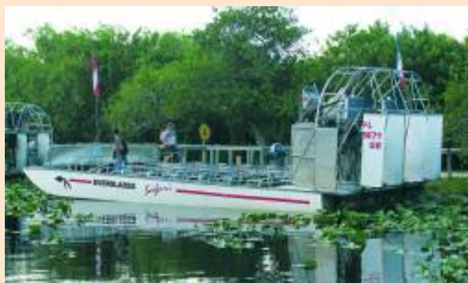
Everglades - Air boat

La sera ceniamo a base di pesce in un ristorante italiano in Lincoln Road. Rientriamo in albergo a tarda ora e ma felici di aver vissuto una giornata molto intensa.