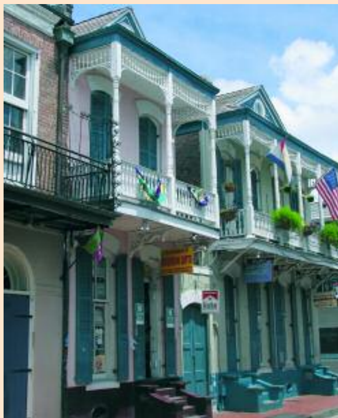
New Orleans - Quartiere francese

G ionata dedicata alla visita della città. Fuori dal campeggio prendiamo un bus pubblico che ci porta al termine della Jefferson Avenue, e qui saliamo sul famoso tram della St. Charles Avenue (famoso perché il regista Tennessee Williams vi girò il film "Un tram chiamato desiderio").