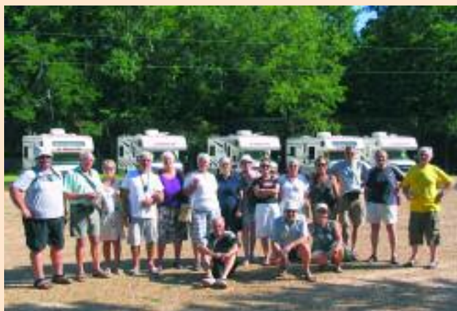
I partecipanti ad Americanada

F inalmente si parte! Il giorno della partenza è arrivato e i bagagli sono pronti; percorriamo l'autostrada verso l'aeroporto un po' emozionati, ma consapevoli di fare un bellissimo viaggio da sempre sognato.