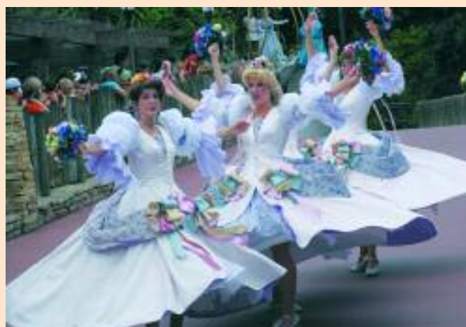
Ballerine a Disneyland

Proseguiamo per il campeggio "Kissimhee Koa" di Orlando dove giungiamo nel pomeriggio inoltrato. Eseguite le operazioni di rito, assistiamo alla celebrazione della messa officiata dal nostro cappellano, Don Pierpaolo, e dopo cena e tutti a dormire, sapendo che ci saranno due giorni di sosta in questa città.