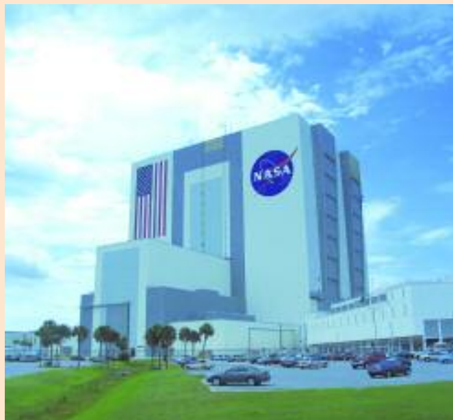
Cape Canaveral - Quartiere generale della NASA

Dopo questo giro interessante, torniamo con i pullman nello spazio di accoglienza dove ammiriamo uno Shuttle, già stato nello spazio.