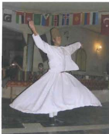
La danza sacra dei Dervisci

ci, impossibile non restare colpiti dalla visita di luoghi che ricordano fasti e culti passati come l'anfiteatro di Aspendos, il museo ed i resti di Aphrodisia, Pergamo sull'alta collina, Efeso con la Biblioteca di Celso e l'anfiteatro, Troia con il suo storico cavallo, che ci riportano ai testi di storia, mettendo a confronto le immagini della nostra fantasia di studenti con quelle che sfilano davanti ai nostri occhi.