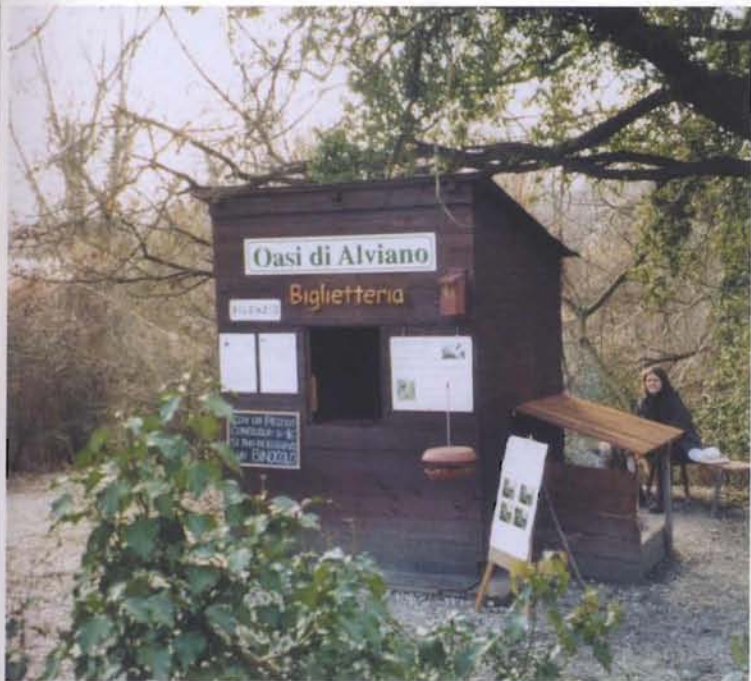
la biglietteria dell'Oasi del WWF ad Alviano

Attraverso un sentiero-natura che si snoda lungo un argine artificiale protetto da incannuciate e provvisto di osservatori e torrette, ci inoltriamo all'interno del bacino per osservare, anche con l'aiuto di cannocchiali, la varia fauna acquatica (gru, aironi cinerini e bianchi, garzette, folaghe, cormorani, svassi, alzavole, germani, mestoloni, tuffetti, beccaccini e tanti altri) e comprendere le forme di vita che qui si sviluppano secondo natura.