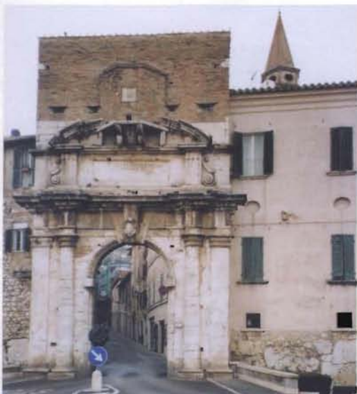
Sopra: Amelia Porta Romana

Seguendo le dotte spiegazioni storiche e artistiche della guida museale signorina Letizia, abbiamo potuto ammirare, fra il cospicuo materiale esposto (oreficerie di notevole pregio, ciste, cippi, ecc.), rinvenuto negli scavi effettuati poco fuori Porta Romana, la statua celebrativa, alta 2,15 m, del giovane condottiero romano "Germanico" (Nerone Claudio Druso, 14 a.C. - 19 d.C.), figlio adottivo di Tiberio e nipote di Cesare Augusto. L'accurato lavoro di restauro e di ricomposizione dei numerosi frammenti in cui fu rinvenuta la sta-