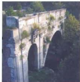
a destra ponte rotto vicino all'isola Tiberina