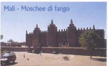
Mali - Moschee di fango

In Senegal l'attraversamento del Niokolo Koba, una riserva popolata da leoni, elefanti, ippopotami ecc.