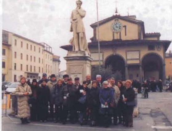
A sinistra il nostro gruppo sotto il monumento a Giuseppe Giusti,