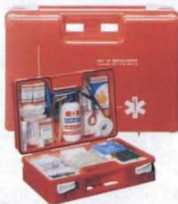
Cassetta di PRONTO SOCCORSO ideale in camper e in auto