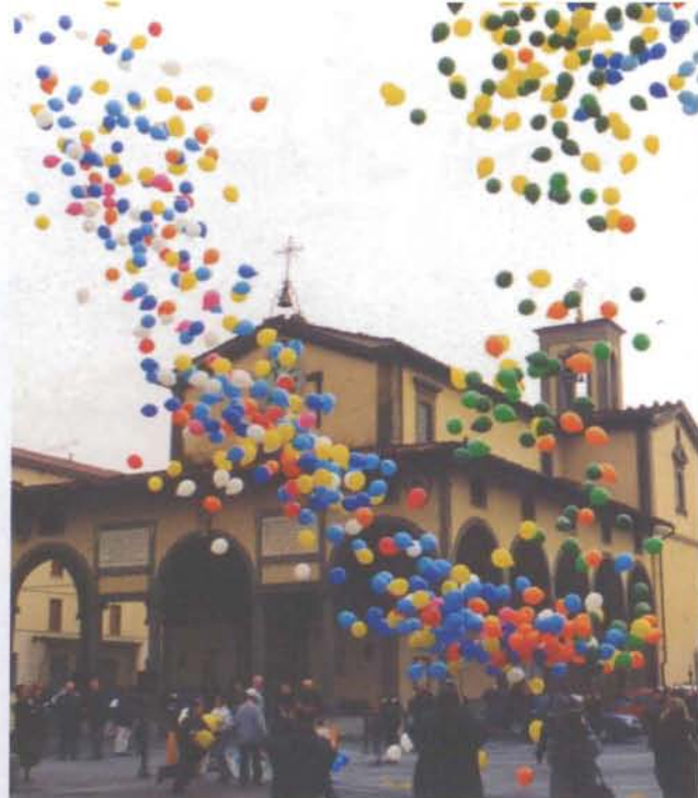
Monsummano (il momento iniziale della festa)