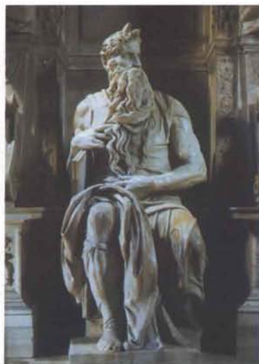
La statua del Mosè al centro della tomba di Giulio II.

R oma, città dai mille segreti e dalle mille scoperte, mai veramente conosciuta, anche ad una giovane camperista romana come me che, nutrendo un particolare interesse per l'arte, specchio del nostro passato, ha voluto intraprendere studi più approfonditi rispetto a quello che può essere una conoscenza generica delle diverse opere.