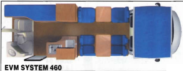
EVM SYSTEM 460

risultato di cui buona parte del merito è da attribuire proprio alle caratteristiche della meccanica.