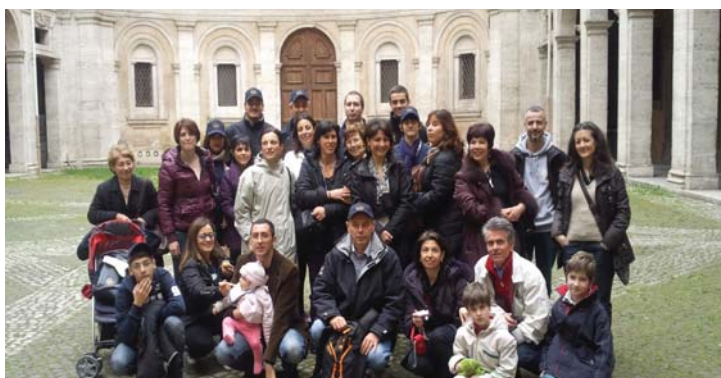
Gruppo "Pro-Roma Mia" in visita a S. Ivo